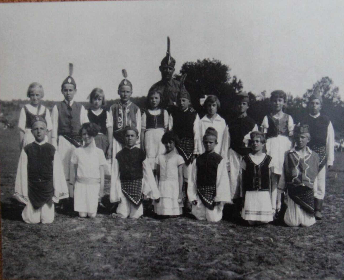
A köveskáli katolikus iskola színjátszó csoportja

„Milyen szép annak az élete, aki közel van Istenhez”